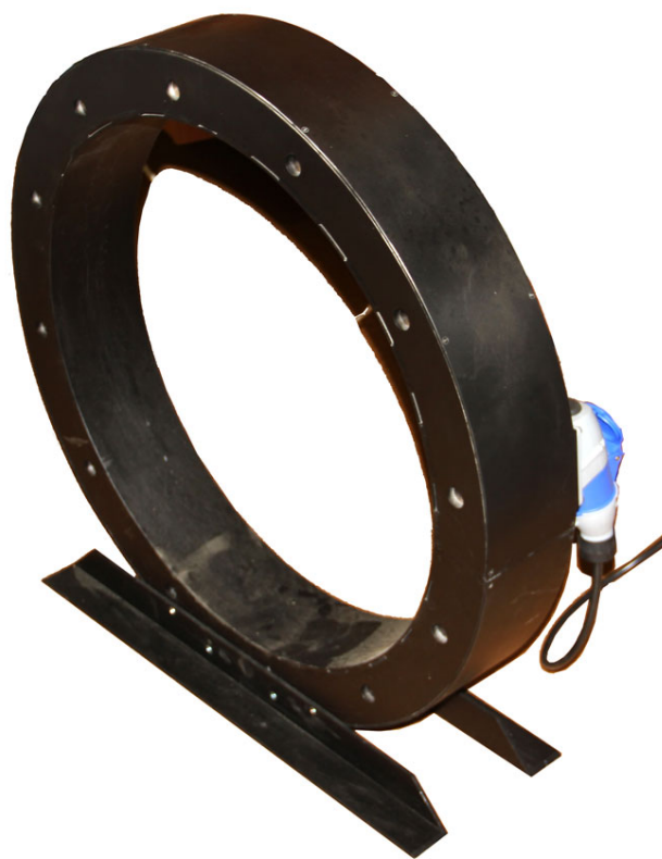
Рисунок 4.4 Внешний вид катушки Э600

С целью создания продольного магнитного поля в комплект модуля входит соленоид с диаметром отверстия 600 мм. Соленоид рассчитан на работу с прибором СМ-30М в режиме длительного включения с током до 15 А (25 А- не более 10 минут).