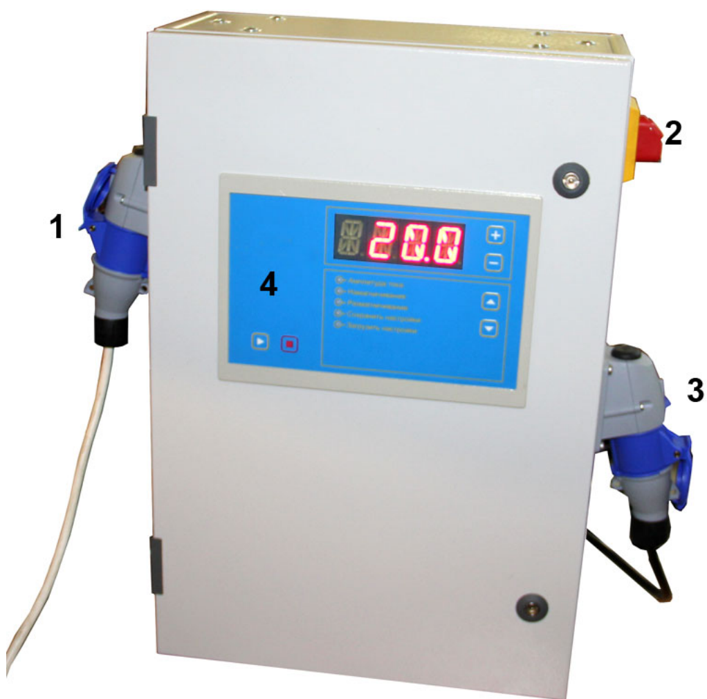
Рисунок 4.2 Внешний вид прибора СМ-30М